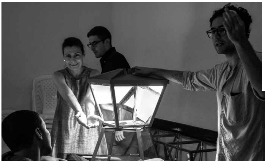
© Dr. Don Slater, Configuring Light Program, LSE

AUTORKA NAVRHLA OSVĚTLENÍ POUŤOVÉ ATRAKCE Z ROKU 1939. PARACHUTE JUMP V NEW YORKU