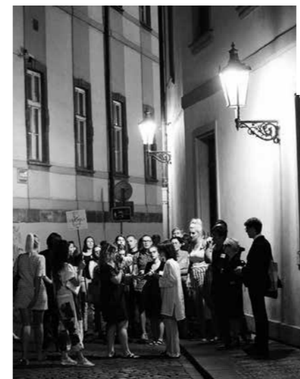
PŘI KOMENTOVANÉ PROCHÁZCE NOČNÍ PRAHOU AUTORKA HOVOŘILA NEJEN O PLYNOVÝCH LAMPÁCH.