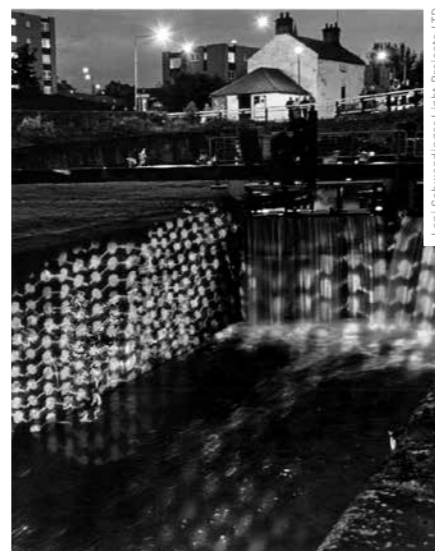
SVĚTELNÁ INSTALACE VODA NAD VODOU OSVLAVILA SKOTSKOU PAMÁTKU FORTH AND CLYDE CANAL.